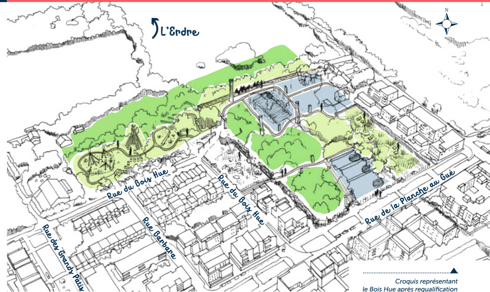
Croquis représentant le Bois Hue après requalification

Pour donner suite au diagnostic phytosanitaire mené par le cabinet APE, une campagne d'entretien s'est déjà tenue début 2024, pour entretenir et mettre en sécurité les arbres qui le nécessitaient. Des grimpeurs-élagueurs ont taillé les bois morts, qui ont ensuite été transformés en copeaux pour servir de revêtement naturel aux nouveaux cheminements. « Parallèlement, les habitants ont pu s'exprimer sur le projet, notamment lors d'une balade sur site l'été dernier en collaboration avec l'agence Radar, poursuit Xavier Glémarec. Cela a été l'occasion de discuter des usages qu'ils souhaitaient pour le bois, de manière à obtenir une vision partagée des aménagements. »