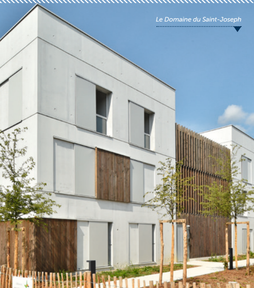
Le Domaine du Saint-Joseph

Réalisées par le groupe CIF, ces deux résidences ont été inaugurées en avril 2023. Comportant 10 logements (7 appartements et 3 maisons en duplex), Ô de l'Erdre a la particularité d'avoir été co-conçue par ses habitants, qui ont imaginé leurs lieux de vie ainsi que les espaces partagés (une salle de 50 m 2 , une buanderie et un local à vélos). À quelques dizaines de mètres, Les Flâneries des Chênes compte 56 logements articulés autour de deux cœurs d'îlots qui mettent en valeur des chênes préservés. Un local de jardinage et une salle commune sont à disposition des habitants, ainsi qu'une bande de terre en frontage, pour y faire des plantations nourricières ou florales.