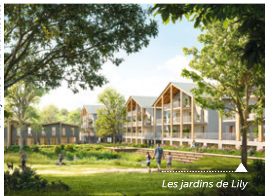
Les jardins de Lily