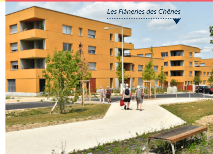
Les Flâneries des Chênes

Rattana, propriétaire primo-accédante aux Flâneries des Chênes.