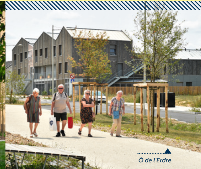
Ô de l'Erdre

Livré en fin d'année 2022, Oakwood est composé de 53 logements en Prêt Social Location Accession (dispositif d'accèsion sociale à la propriété destiné aux ménages aux ressources modestes), allant du T2 au T5. Réalisé par Vilogia et conçu par les architectes Odile Seyler et Jacques Lucan, associés à Avenir Cornejo, il vient compléter le programme Aulnéo, livré en mars 2022. Équipé soit d'une terrasse soit d'une loggia, chaque logement bénéficie d'une double orientation et offre une ouverture sur les paysages environnants, notamment sur un "cœur boisé" préexistant à la construction du bâtiment, tout en permettant un accès direct aux espaces publics des Vergers du Launay. Dans une optique de valorisation des nouvelles formes de mobilités, les habitants du programme bénéficient d'un véhicule en autopartage.